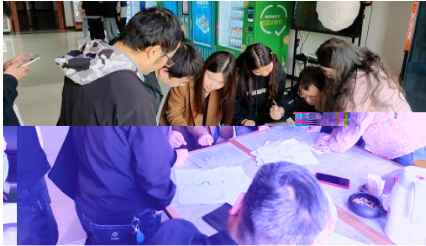
图 卓越团队建设共识营